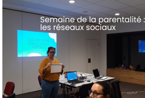
Semaine de la parentalité : les réseaux sociaux