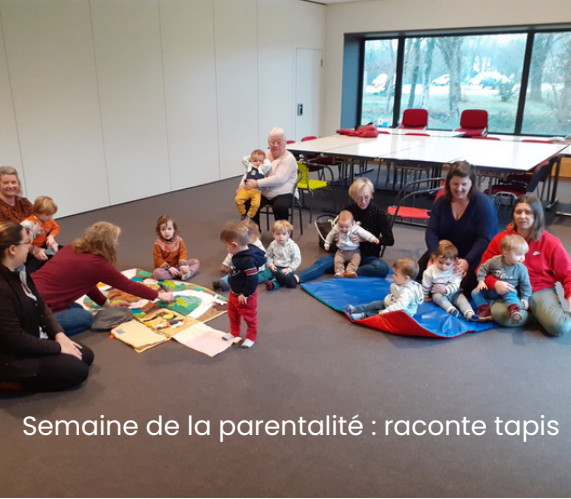
Semaine de la parentalité : raconte tapis