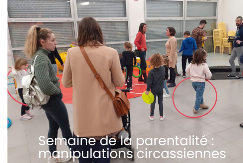
Semaine de la parentalité : manipulations circassiennes

Accueillir, partager, animer, impulser..