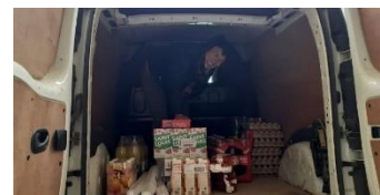
250 oeufs, 50 litres de lait, 25 kg de farine...