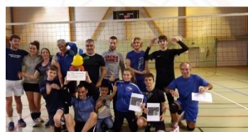
Tournoi de volley

Félicitations à l'équipe "Les Bras Tcha Tcha" qui a remporté le trophée !