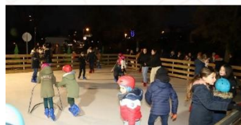
Holiday on ice by night