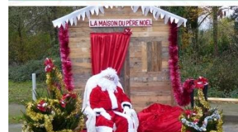
Sans oublier le père Noël

Félicitations à l'équipe "Les Bras Tcha Tcha" qui a remporté le trophée !