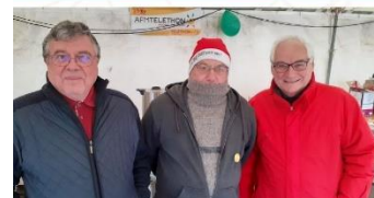
Quel est leur point commun ?