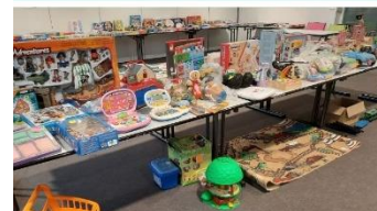
La bourse aux jouets