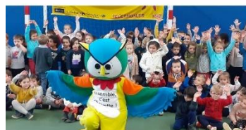
Il n'y a pas que la mascotte qui prend son envol