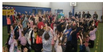
Qui est au milieu des enfants ?